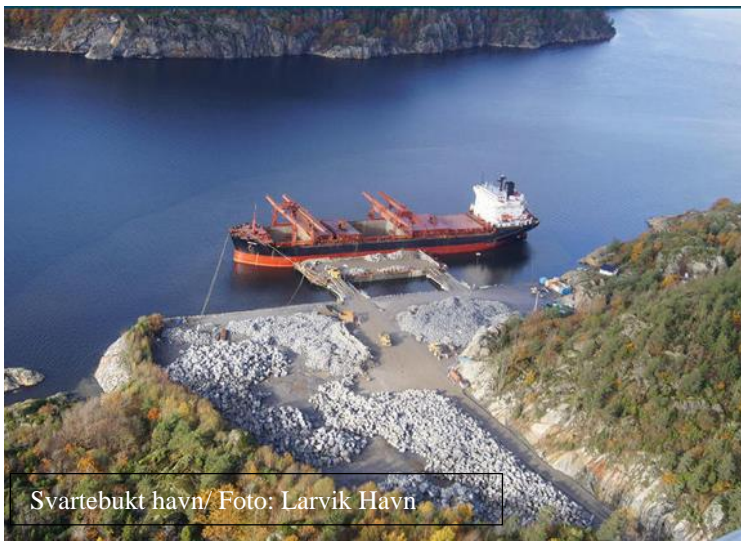
Svartebukt havn/ Foto: Larvik Havn

BONTRUP AGGREGATES B.V. er en erfaren aktør i markedet med god innsikt og oversikt over behovene for stein til kystsikring. De håndterer logistikken med egne skip.